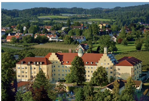
Asklepios Klinik Lindau

Ich operiere seit 20 Jahren bei erstmaligem Hüftgelenkersatz ausschließlich mit dieser Technik und habe über 4.500 Patienten mit dieser schonenden Operationsmethode behandelt.