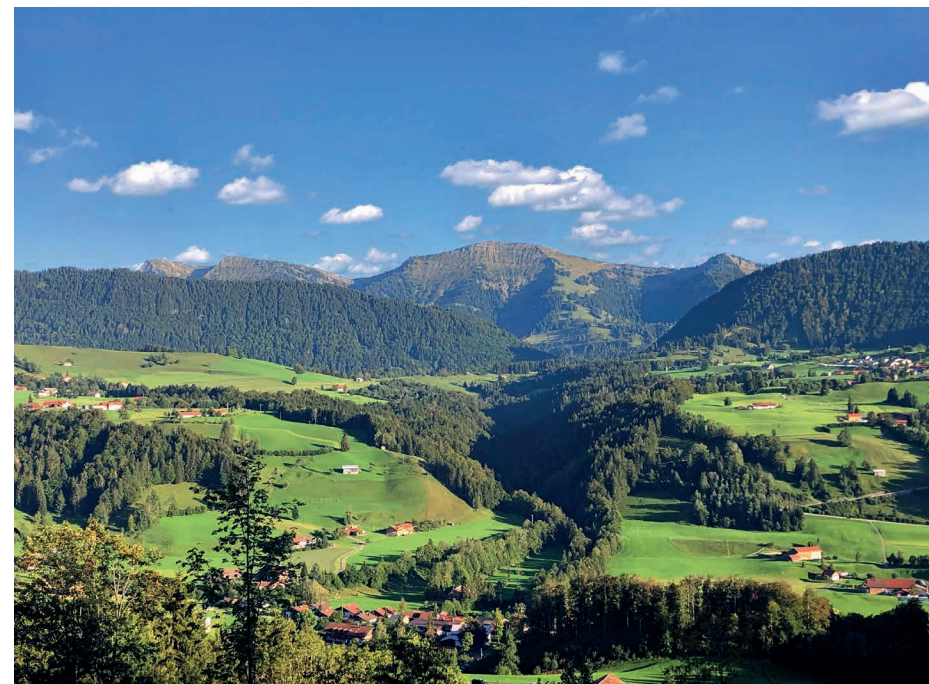
Ausblick vom Hotel Allgäu Sonne auf Hochgrat und Nagelfluhkette.

Diese Broschüre ist gültig ab November 2023 und verliert mit Erscheinen einer neuen Broschüre ihre Gültigkeit. Änderungen vorbehalten.